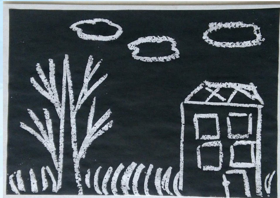
Рисунок свечой остаётся белым.

Способ получения изображения: ребёнок рисует свечой на бумаге. Затем закрашивает лист акварелью в один или несколько цветов.