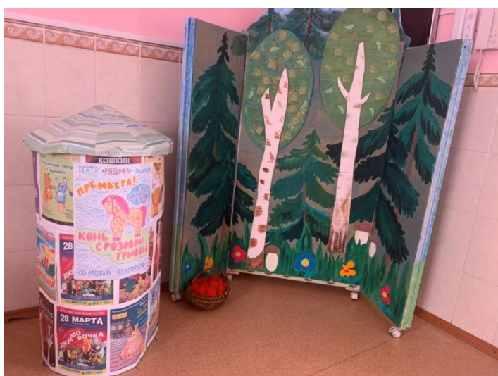
Афиша спектакля «Конь с розовой гривой»