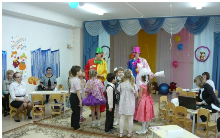
Дети находят карты с маршрутами заданий.