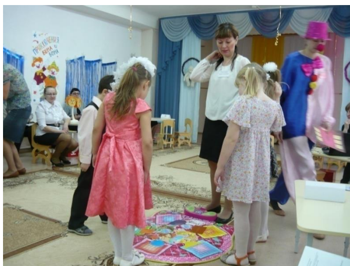
Выполняют задания на развивающем «коврике»