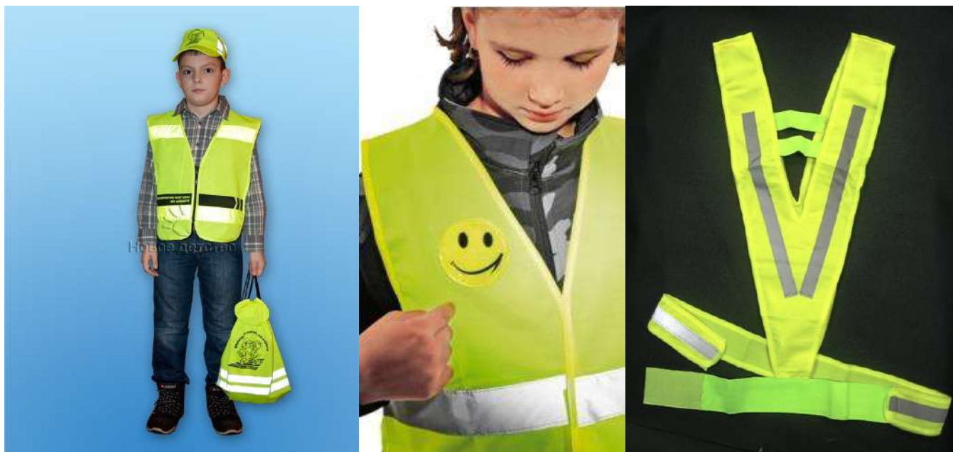
Рис.5. Сигнальные жилеты и ременные системы