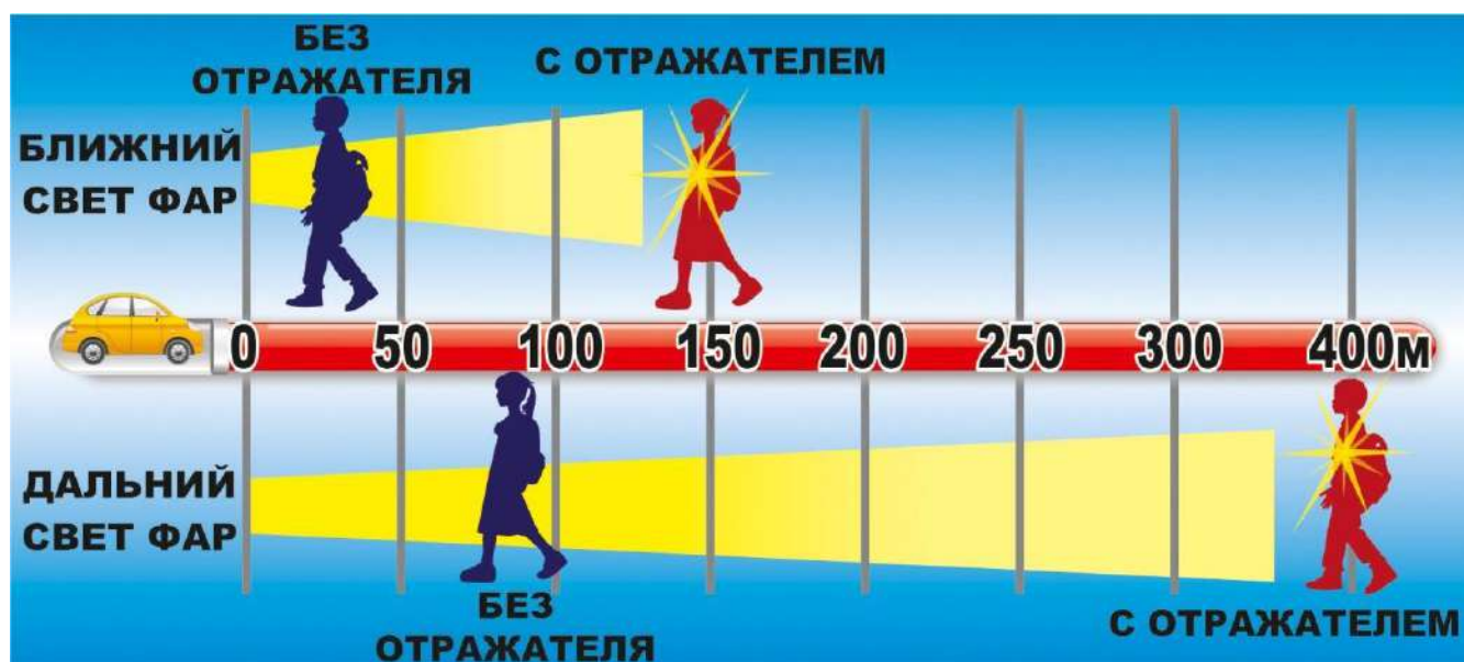
Рисунок 1. Дальность обнаружения человека при различных условиях

метров. Это означает, что водитель имеет гораздо больше времени, чтобы отреагировать на ситуацию с пешеходом.