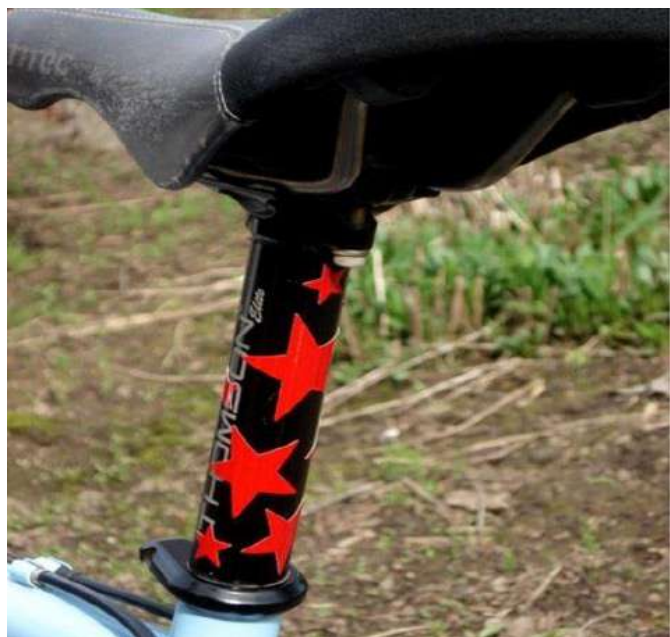
Рис. 4. Световозвращающие наклейки.