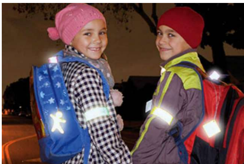
Рис. 8. Размещение световозвращающих элементов

Световозвращающие элементы (наклейки, брелоки, браслеты) могут располагаться на одежде в любом месте, а также на сумках, рюкзаках или портфелях (Рис. 8).