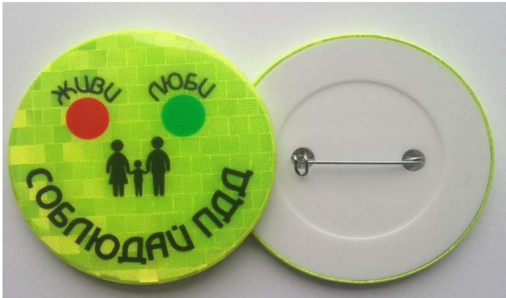
Рис. 3. Световозвращающий значок.