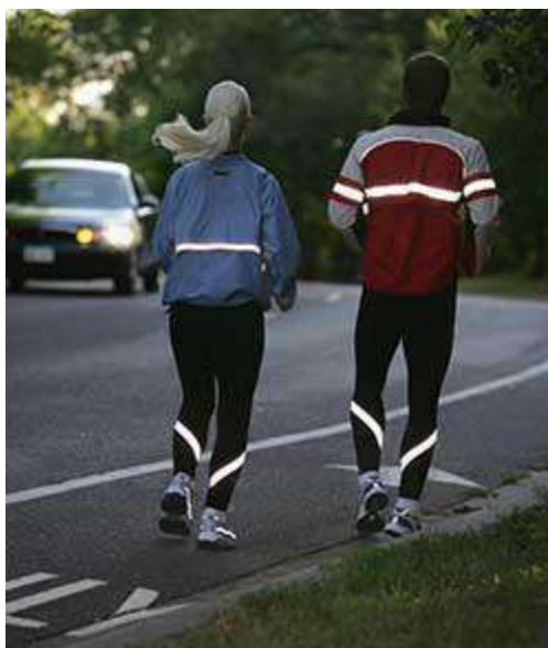
Рис.6. Несъемные световозвращающие элементы