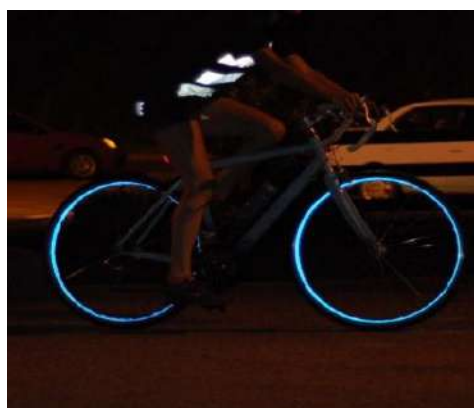
Рис. 10. Нашивки из световозвращающей ленты